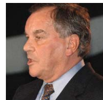
Richard Daley , Sindaco di Chicago (Stati Uniti)